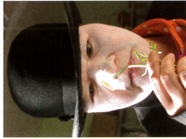
Hier bin ich Mensch, hier darf ich's sein. (Johann Wolfgang von Goethe)